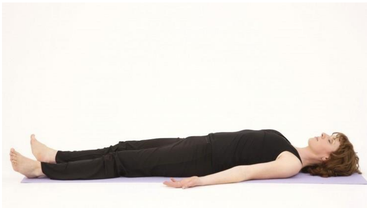
Posición Decúbito Supino

Se tumbará a la estudiante en decúbito supino (acostada boca arriba en plano paralelo al suelo), salvo disminución de nivel de conciencia, en los que se colocará a la estudiante decúbito lateral (acostada de lado en plano paralelo al suelo)